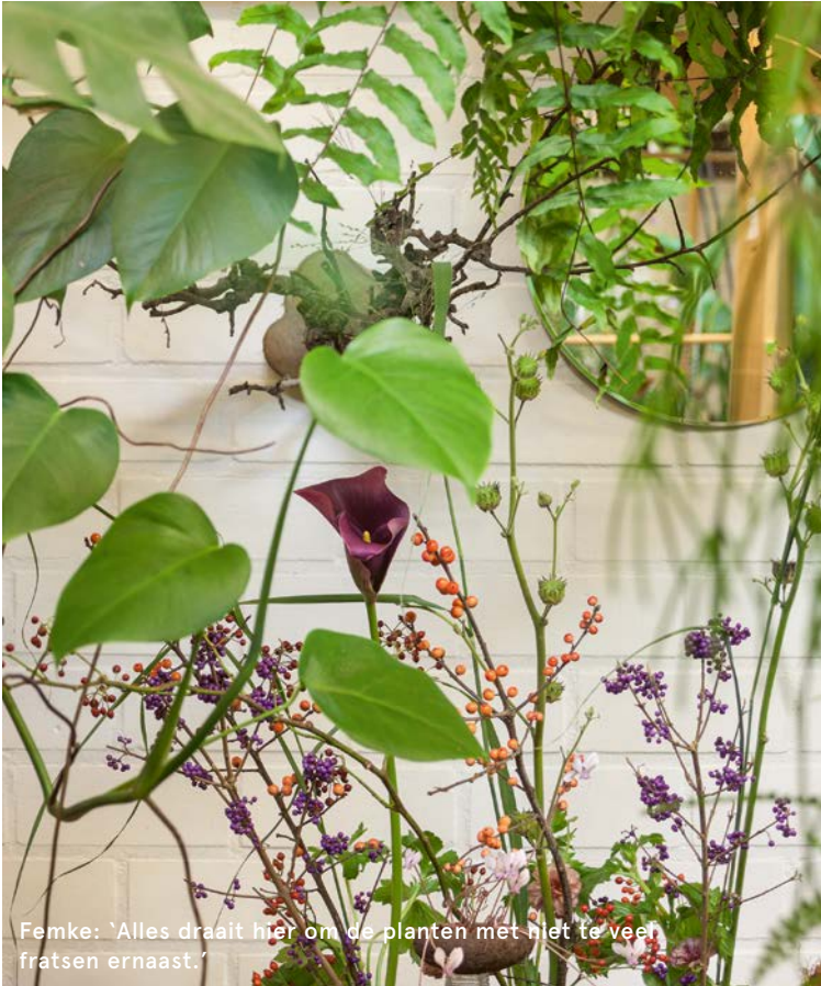
Femke: "Alles draait hier om de planten met niet te veel fratsen ernaast."