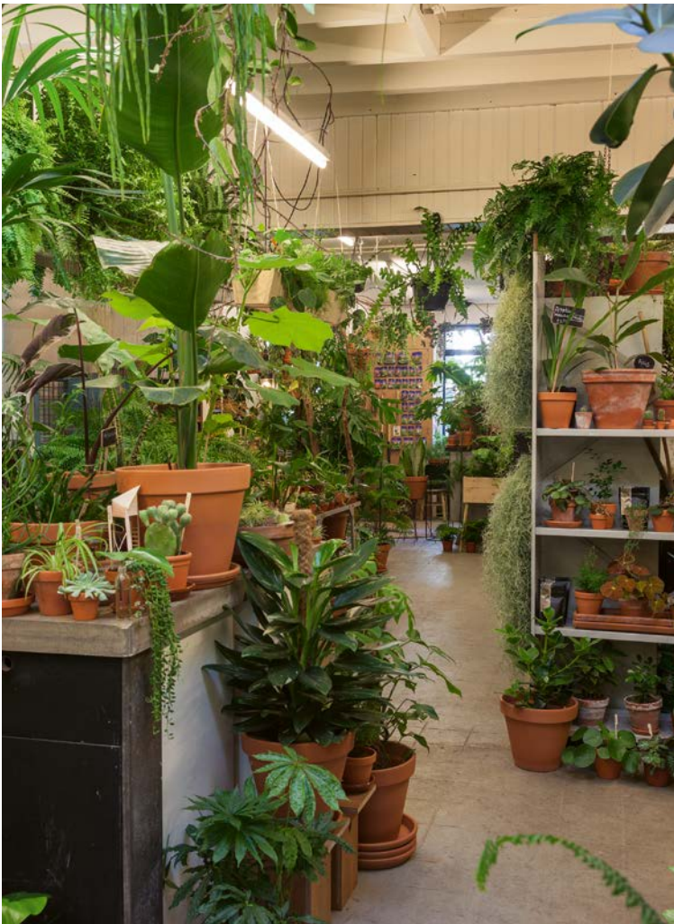
Alle planten staan in terracotta potten van aardewerkfabriek Den Daas uit Aalsmeerderbrug.